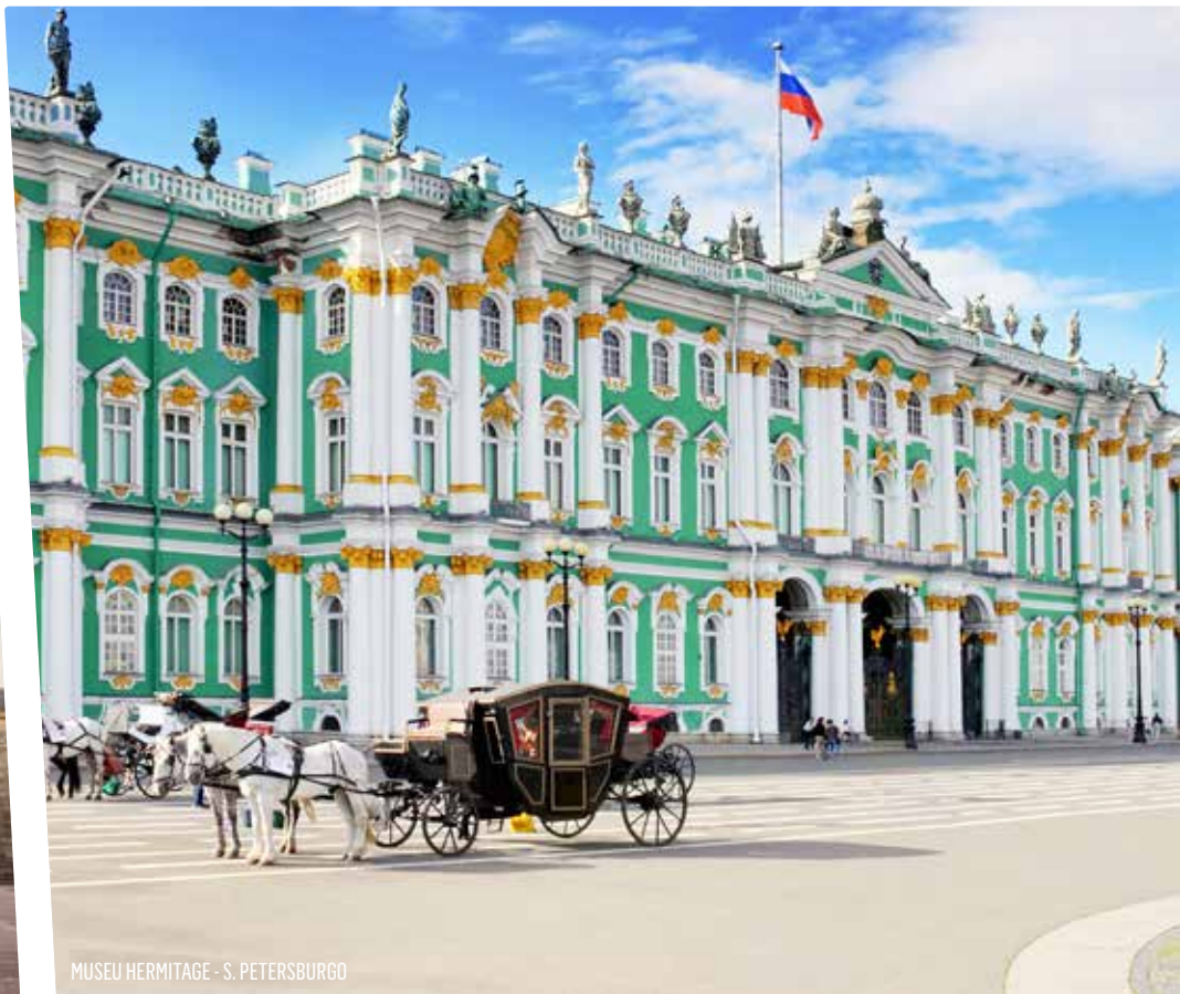
MUSEU HERMITAGE - S. PETERSBURGO