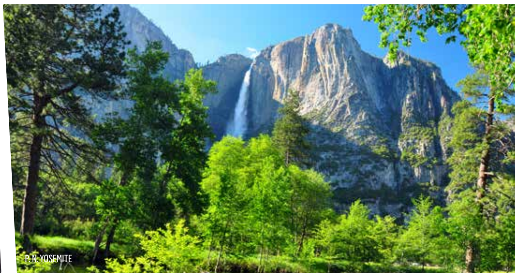
P. N. YOSEMITE