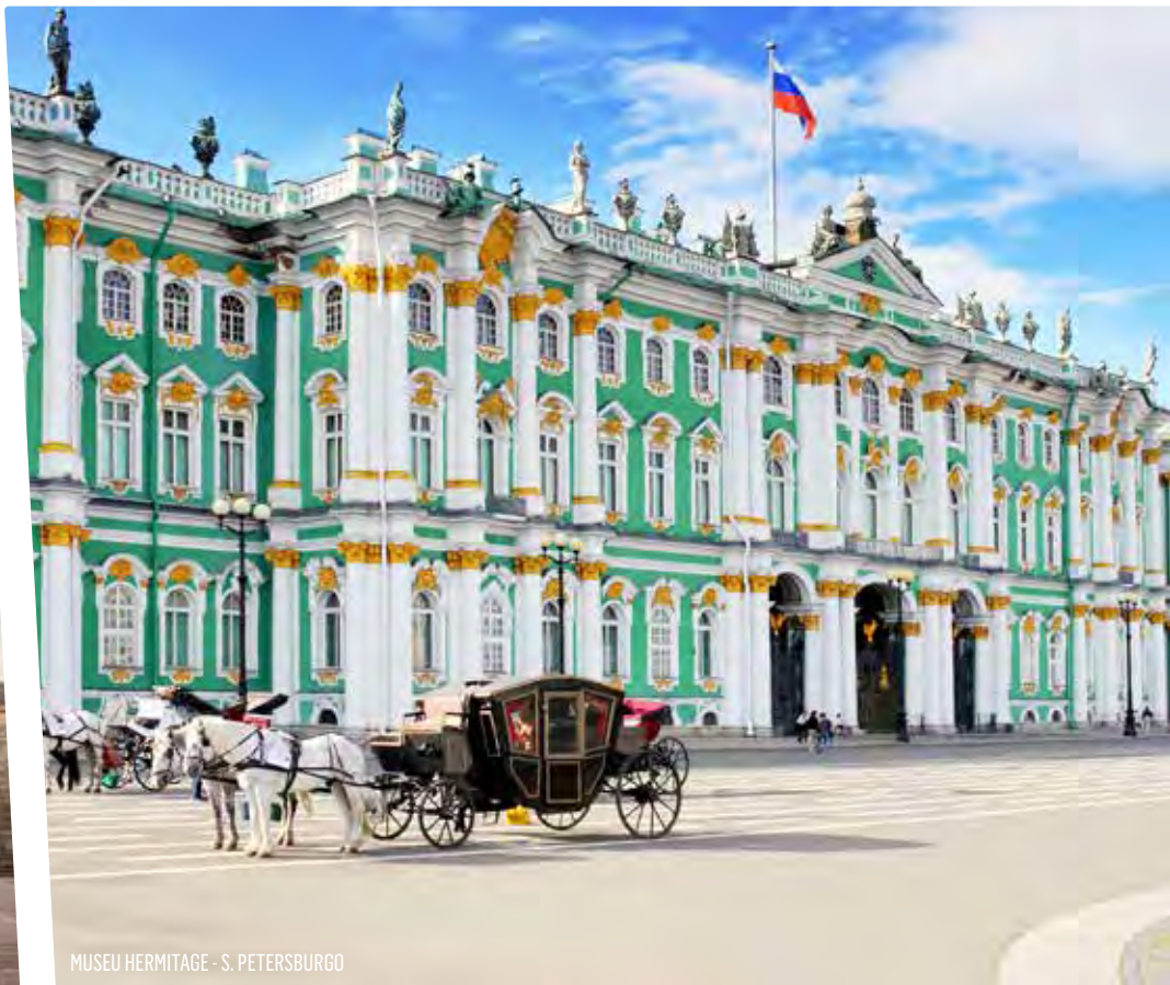
MUSEU HERMITAGE - S. PETERSBURGO