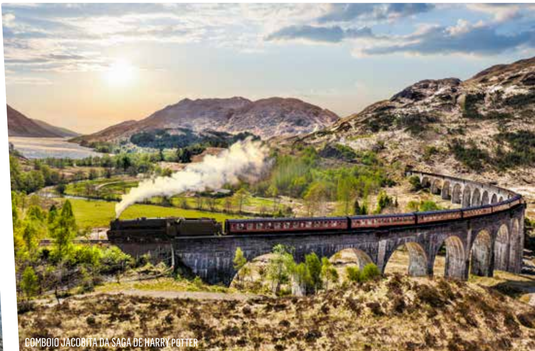
COMBOIO JACOBITA DA SAGA DE HARRY POTTER