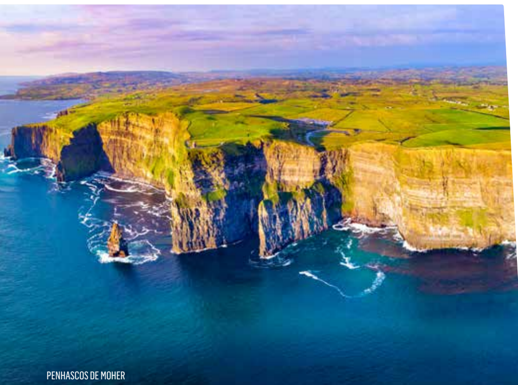
PENHASCOS DE MOHER