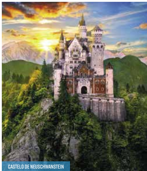
CASTELO DE NEUSCHWANSTEIN